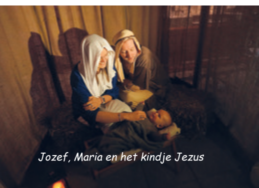
Jozef, Maria en het kindje Jezus

Behalve het jeugd- orkest in de Chris- tus Koningkerk was er nog meer muziek te horen. Een groep midwin- terhoornblazers was te zien en te horen bij de vijver aan de Holtmaet.